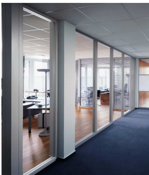
links: Programm ModulASS für die Raum trennenden Glaswände unten: Foto nach Montage

Es bestand aber die Anforderung, mehr Besprechungsbereiche im Gebäude zu schaffen. Durch die räumliche Abtrennung mit Glaswänden ist der Eingangsbereich jedoch sehr hell geblieben. Es wurden 2 neue Besprechungsräume für jeweils 8 Personen geschaffen.