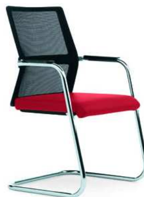
Hersteller RovoChair Modell XN

Hier bestand die Kundenanforderung darin, möglichst viel Stauraum (zum Teil abschließbar) zu schaffen. Mit dem Regalsystem Progress 500 unseres Herstellers Kerkmann konnten wir ein kostengünstiges, aber trotzdem sehr belastbares Regalsystem liefern.