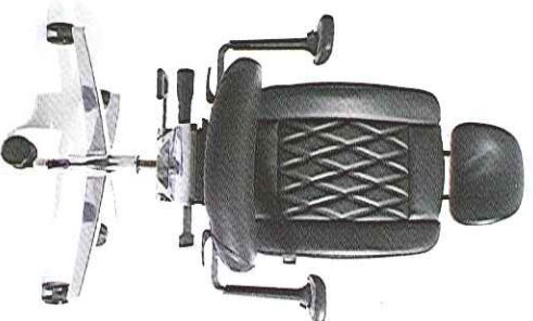
AluMedic® Limited „S“

AluMedic® Ltd. „S“ Aktionspreis ab € 1.499,- inkl. MwSt.