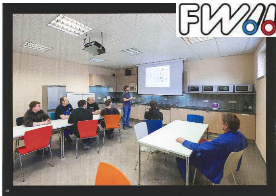
FW Fernwärme Celle

weitere von uns realisierte Einrichtungsbeispiele: