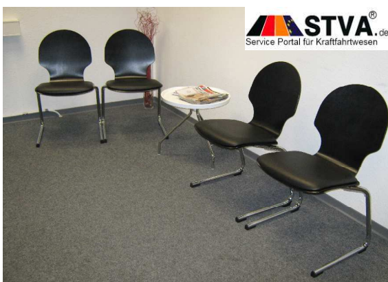
Stadt Bergen - Zulassungsstelle