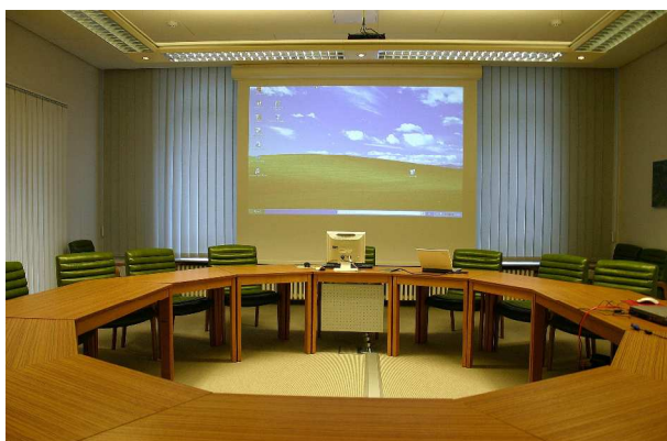
Raumansicht nach Montagearbeiten mit herausgefahrter Leinwand, Beamer deckenseitig montiert und der Tischverkabelung ab dem Bodentank über Aufbodenkanäle