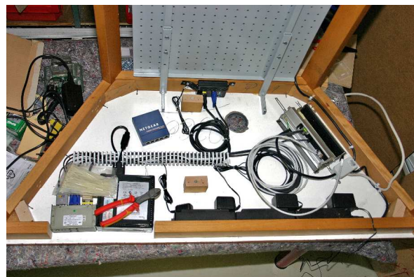
Unterbringung der Verkabelung der gesamten Technik im Bürgermeister Tisch