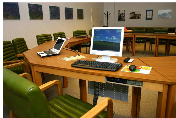
Ansicht Bürgermeister Tisch mit Medienport für Anschluss Notebook und Zugang zu Mini-Rechner (Focus Congress als interaktives Tischboard wird noch aufgestellt)