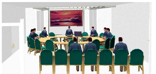
3D Simulation der installierten Technik für eine öffentliche Sitzung mit anwesenden Bürgern.