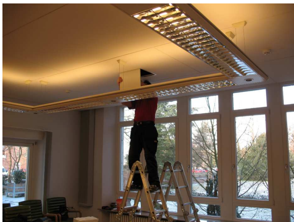
Montagearbeiten in der abgehängten Decke