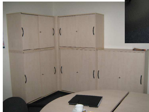
Schiebetürenkombination über Eck mit Inneneckverblendung