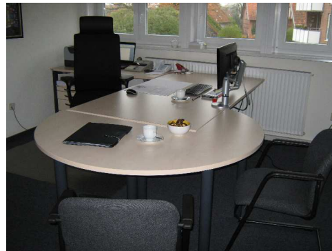
Schreibtisch in Stehhöhe

Die Kundenanforderung nach einem elektromotorisch höhenverstellbaren Schreibtisch mit Besprechungslösung und Unterbringung des vorhandenen Stauraumes haben wir mit den Möbelprogrammen Canvaro500 und Pontis unseres Herstellers Assmann Büromöbel umgesetzt.