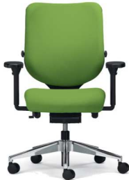
XT 3020 EB