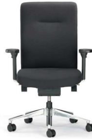
XP 4015 EB