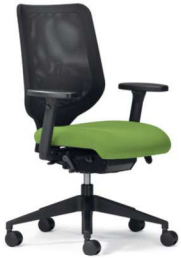
XT 3010 EB

Die neue Dynamik im Sitzen mit Ergo-Balance-Technik. Genießen Sie diese Freiheit!