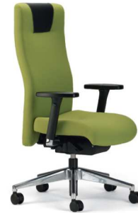
XP 4020 EB