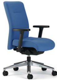
XP 4010 EB