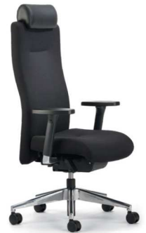
XP 4030 EB