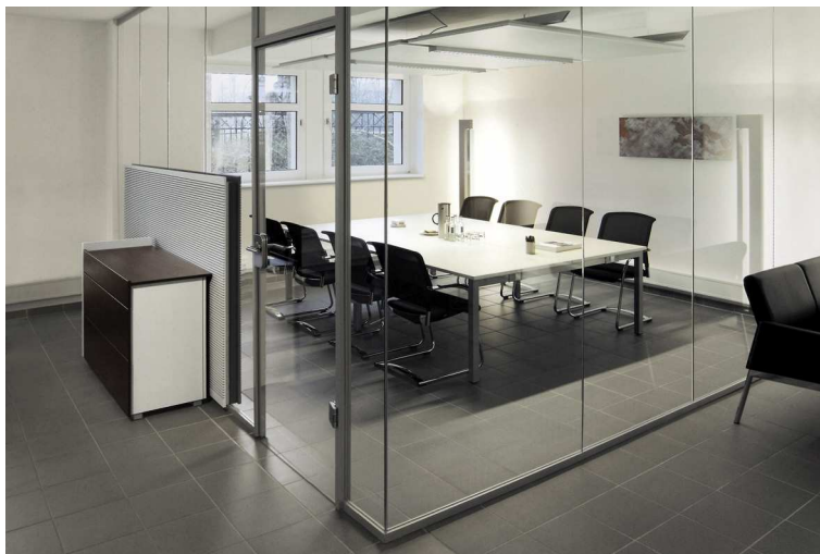
Raum trennende Glaswände ModulASS