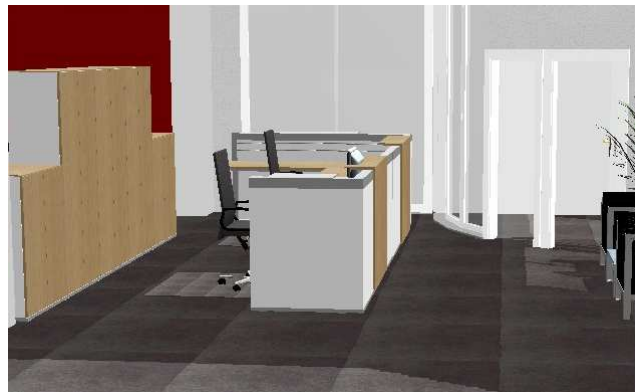
Nerak Fördererlemente - Empfang